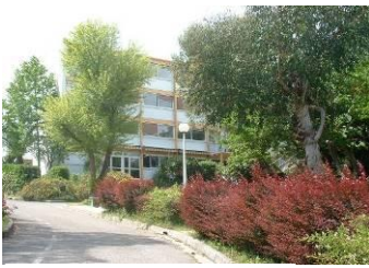
Lycée les Fauvettes CANNES