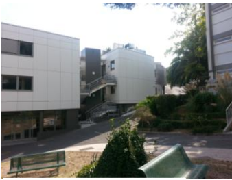
Lycée les Fauvettes CANNES